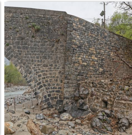
Reprise du mur en pierres maçonneries