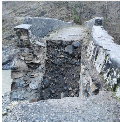
Trou dans le tablier du pont